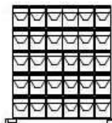
¼ Galón (Empaque 12 Unid.)